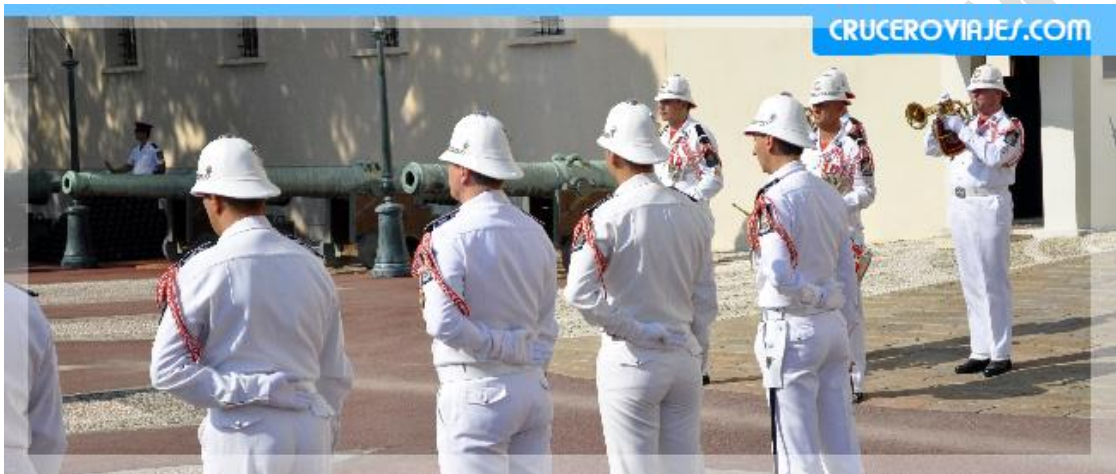
Cambio de guardia

Sacar los billetes de dos en dos si vais en parejas, no sacar por ejemplo 6 si vais tres parejas, el motivo..., Alguien se puede perder en el destino, o simplemente decidir volver antes o después por cualquier motivo, de esa forma podréis hacerlo sin estar condicionados. Antes de la subida por las escaleras hacia la estación, si vuestra idea es disfrutar de un día de playa, a vuestra derecha tenéis una para broncearos y refrescaros un poco.