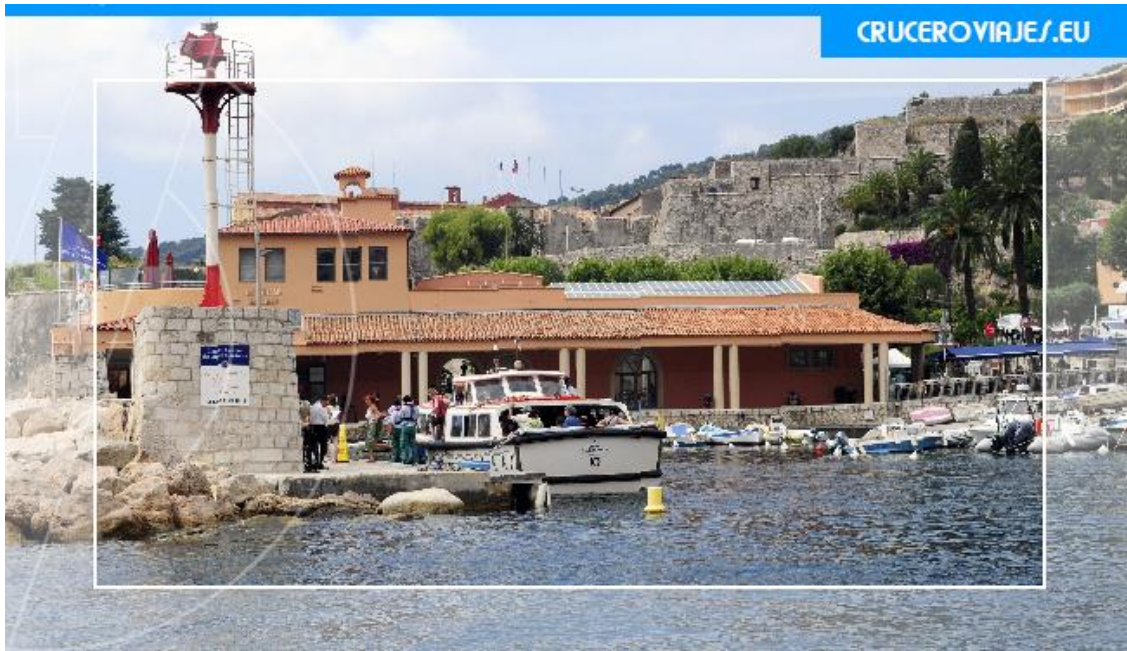
Embarcadero en Villefranche