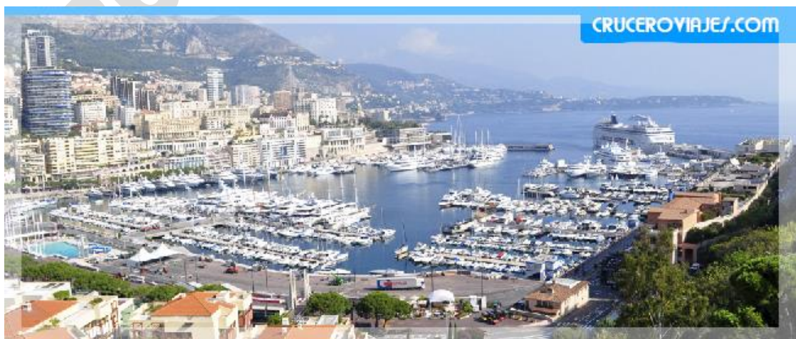
Puerto deportivo, al fondo, la terminal

Volvamos a recordar que el cálculo del tiempo es importante para hacer la visita relajadamente, incluso dependiendo del horario de partida del barco, podréis volver tranquilamente al mismo a comer o tomar algo, y bajar un rato si os apetece ver Villefranche.