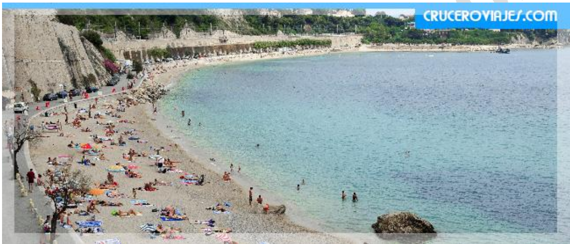
Playa de Villefranche

Como hemos comentado anteriormente, Villefranche no tiene puerto en el que puedan atracar los cruceros, por tanto, nuestro desembarque se realizará por medio de lanchas ya que el barco queda fondeado en el mar, con lo cual, si el día se complica con climatología adversa, se puede perder esta escala, pero no es la única en esa zona, hay varias escalas conocidas con el mismo problema, por lo cual, muchas navieras buscan escalas alternativas donde poder embarcar/desembarcar con menos problema.