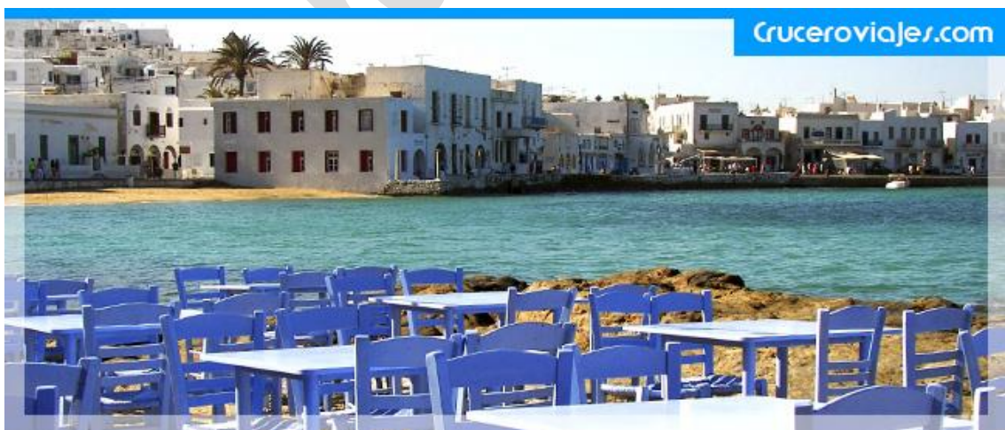
Entrada a Mikonos

Os dejo un pequeño fragmento de Wikipedia : " Isla minúscula (3,5 km 2 ), árida, deshabitada desde hace tiempo, se sitúa enfrente de la isla de Rinia (14 km 2 , deshabitada) y en las proximidades de Mikonos. Sus pendientes son suaves y el monte Cinto no sobrepasa los 113 m. El puerto ha sido siempre mediocre y, cuando los vientos se levantan, la isla es inaccesible. Delos tiene unos 8 km de costa. La única ciudad de la isla fue Delos, hoy día un conjunto de ruinas al noroeste de la isla ".