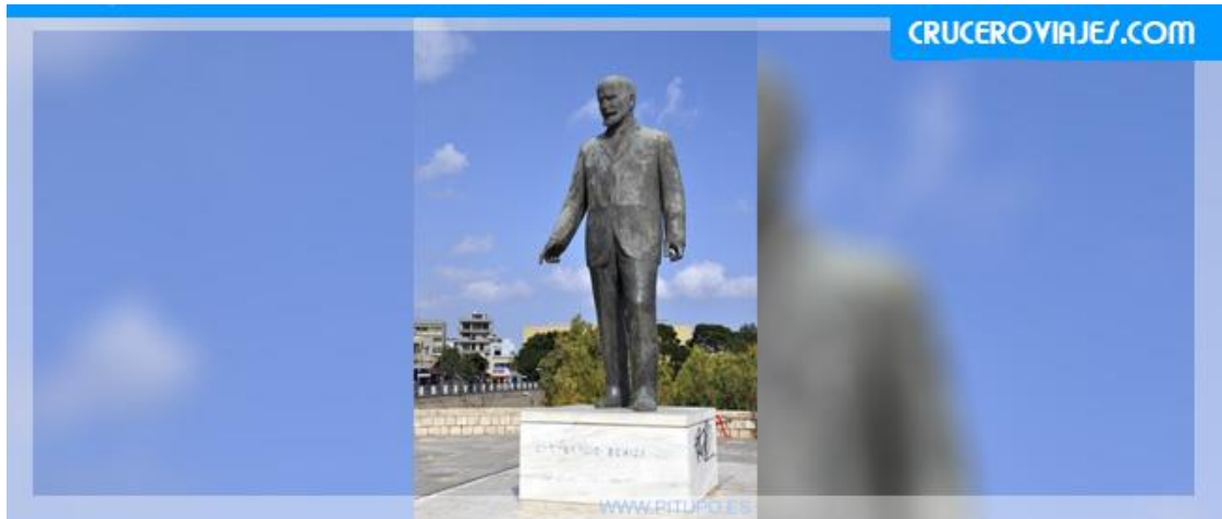
Monumento a Eleftherios Kyriakou Venizelos

El Fresco de los delfines , muy bien restaurado, no os lo debéis perder, la mayoría de visitantes lo pasan por alto, es digno de ver así que no olvidéis de traer un buen recuerdo en vuestras cámaras.