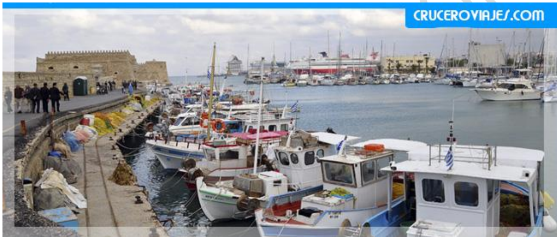
Al fondo el Castello a Mare

Creta , es la isla más grande de Grecia , lo más visitado por los turistas en este destino es el Palacio de Knossos . Como siempre comentamos, hay varias formas de moverse por esta isla, todo dependerá de vuestras preferencias.